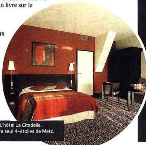
L'hôtel La Citadelle, le seul 4-étoiles de Metz.